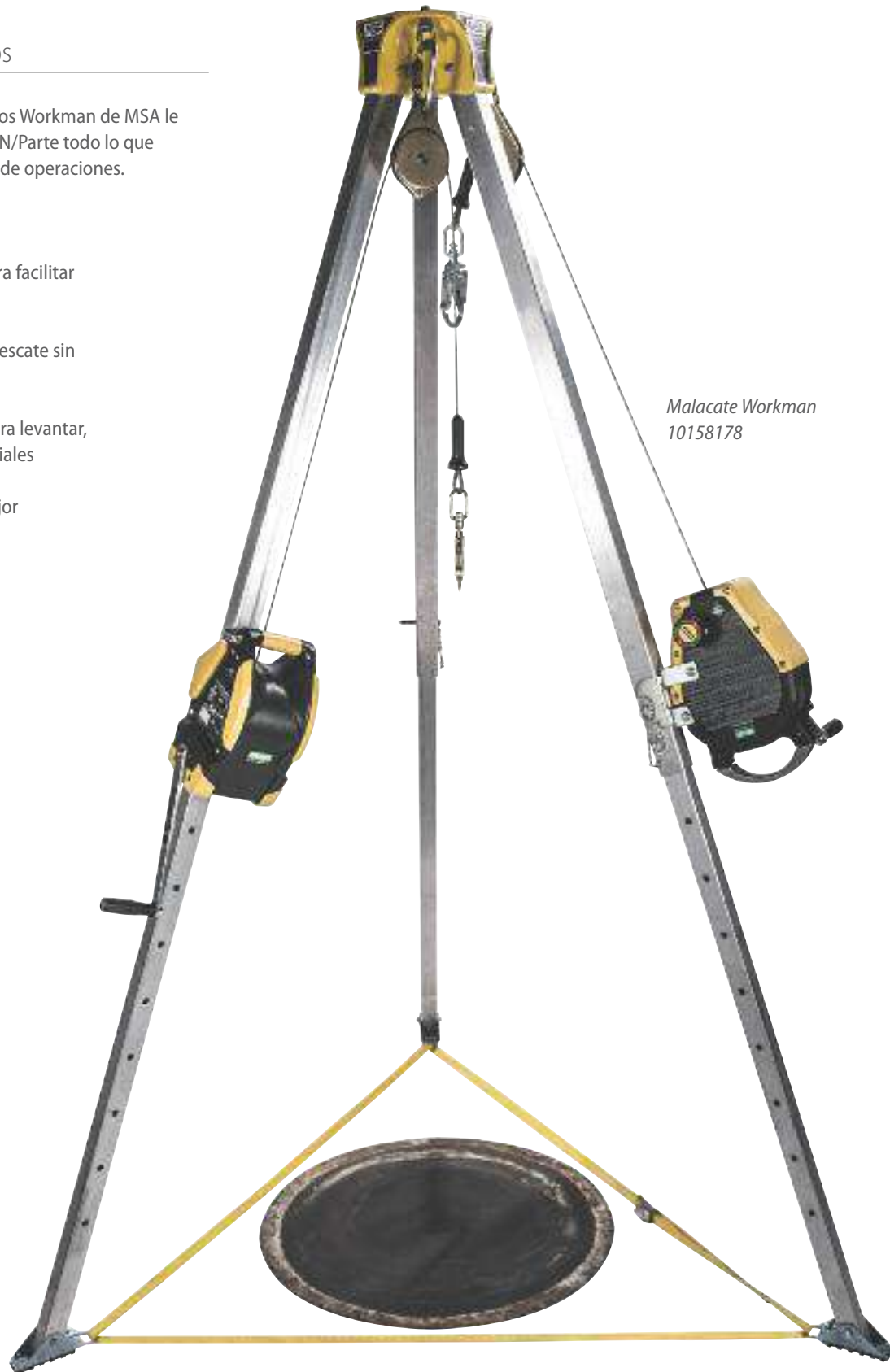
Malacate Workman 10158178